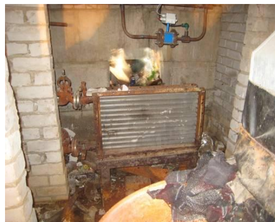
Счетчик горячей воды

Сравнение показателей счетчиков до и после реализации мер по энергосбережению позволит подсчитать точный объем сэкономленной энергии.